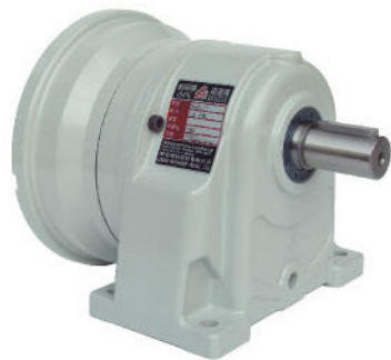
尺寸表 Dimension (m/m)